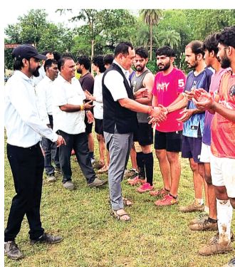
हरिभूमि न्यूज ॥ ब्यावरा