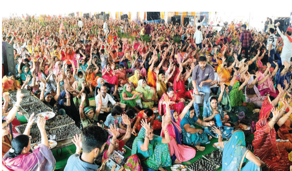
हरिभूमि न्यूज ॥ नरसिंहगढ़

नगर के नृसिंह स्टेडियम में चल रहे सवा करोड़ पार्थिव शिवलिंग निर्माण एवं रुद्राभिषेक महाआयोजन के दूसरे दिन भी श्रद्धा और आस्था का सैलाब उमड़ा। हजारों की संख्या में महिला-पुरुष श्रद्धालु सुबह से ही शिवलिंग निर्माण के लिए पहुंच गए थे। दिनभर चले अनुष्ठानों में श्रद्धालुओं ने लाखों शिवलिंग का निर्माण कर रुद्राभिषेक किया। महिलाओं द्वारा सामूहिक रूप से रुद्रा निर्माण एवं पुरुष श्रद्धालुओं द्वारा रुद्राभिषेक से वातावरण शिवमय रहा। चारों ओर रूजते मंत्रोच्चारण और भक्तिमय गीतों पर श्रद्धालु