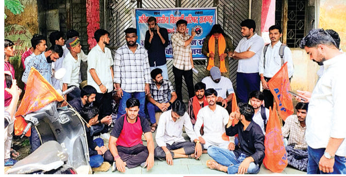
हरिभूमि न्यूज ॥ राजगढ़